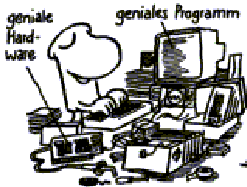
Der wahre Hacker